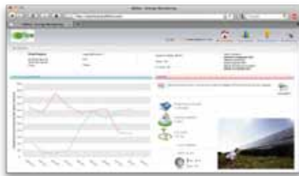
✓ Portail Web " Investisseur "