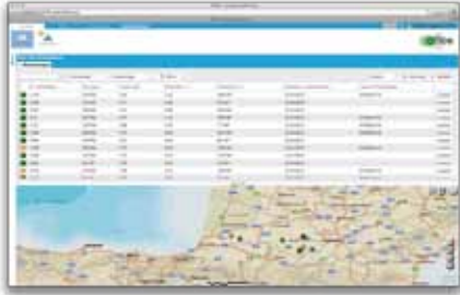
✓ Localisation des sites