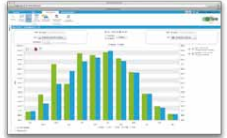
✓ Analyse des données